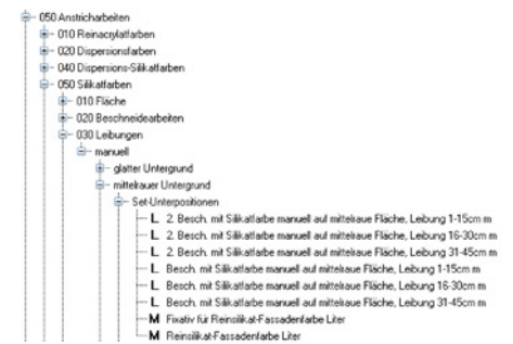
Beispiel einer prozessorientierten Leistungsposition mit einzeln kalkulierten Verrichtungen als Unterpositionen in WinWorke

In der Bau- und Ausbaubranche etabliert sich immer stärker DATANORM als Standard für den Artikel-/Stammdatenaustausch (s. Glossar). Die Mehrzahl der ERP-Softwares ist in der Lage, eine DATANORM-Datei mit Materialinformationen einzulesen. Meist beinhalten die eingelesenen Materialien einen Kurztext zur Materialbezeichnung, eine Gebindeeinheit, den Preis und die Artikelnummer des Herstellers/Lieferanten. Leider werden selten mehr Datenfelder gefüllt. Besonders wichtig ist z. B. das eindeutige